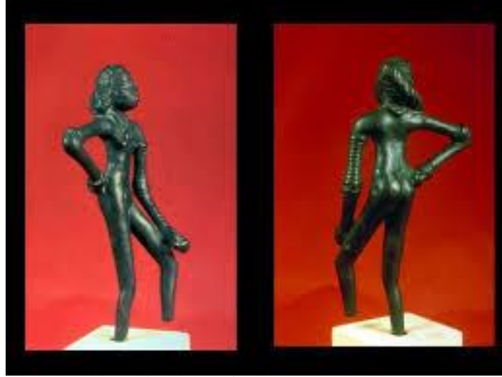
चित्र सं.-1—मोहनजोदाड़ों की नर्तकी की धातु की मूर्ति

वस्तुओं पर पड़ा और एक प्रकार से उसने सामूहिक रूप ले लिया। मोहनजोदाड़ों की नर्तकी की धातु की मूर्ति से उस काल की कला का स्तर, दृष्टिकोण एवं आवष्यक गुण हमें स्पष्ट परिलक्षित होते हैं और यदि हम बाद की धातु मूर्तियों में देखें, जो कि दसवीं शताब्दी से प्रचुर मात्रा में बननी प्रारम्भ हो गई थीं, तो नर्तकी उन सब गुणों से परिपूर्ण हैं जो एक उच्च कोटि की मूर्ति में होने चाहिए। नटराज की काँसे की मूर्ति की भावपूर्ण गतिशीलता में हम परम्परागत कला सौन्दर्य के सब लक्षणों के साथ-साथ आधुनिक मापदंडों द्वारा भी सर्वगुण सम्पन्न पाते हैं।