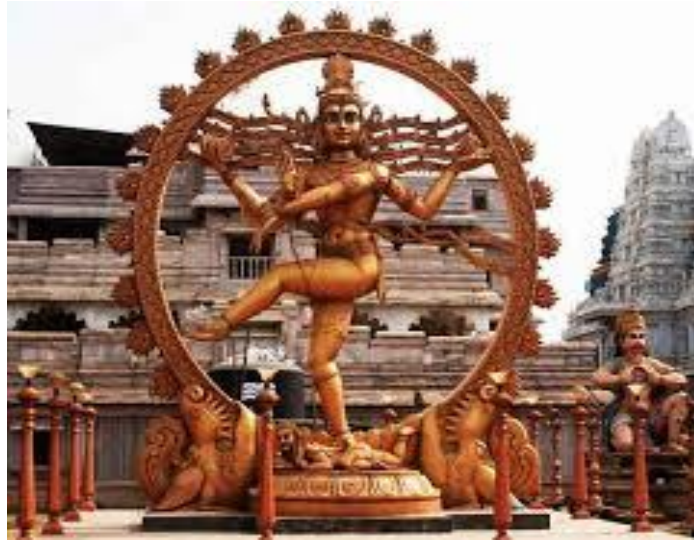
चित्र सं.-2— नटराज की काँसे की मूर्ति

सभी कलाओं का भौति धातु और काष्ठ की मूर्तियाँ भी विदेशी राज्य के भिन्न दृष्टिकोण के कारण और उचित संरक्षण तथा प्रोत्साहन के अभाव में निर्जीव व रुद्धिग्रस्त हो गईं। कहीं उसका लोप हुआ तो कहीं उनके कुशल कारीगरों ने जीवननिर्वाह के लिए अन्य काम सम्भाल लिए। शिक्षित कलाकारों ने भी विदेशी कला का अनुसरण किया किन्तु अब फिर इन खोजी हुई वैभवशाली कलाओं की ओर ध्यान दिया जा रहा है और अनेक कलाकारों ने आज काष्ठ मूर्तिकला को अपना माध्यम बनाया है जिसमें भारतीय भारतीय